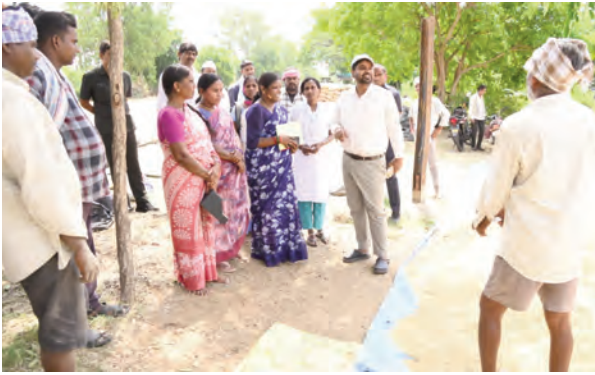
ప్రసంగిస్తున్న ఉద్యానవన అధికారిణి కందుల సహజ

రైతు సంక్షేమంలో భాగంగా ప్రభుత్వం ఏర్పాటు చేసిన కొనుగోలు కేంద్రాల ద్వారా నిబంధనల ప్రకారం రైతుల వద్ద నుండి వరి ధాన్యం కొనుగోలు చేయడం జరుగుతుందని జిల్లా కలెక్టర్ కుమార్ దీపక్ ఆన్నారు. మంగళవారం జిల్లాలోని భీమారం మండలం పొలంపల్లి గ్రామంలో ఏర్పాటు చేసిన వరి ధాన్యం కొనుగోలు కేంద్రాన్ని సందర్శించి ధాన్యం కొనుగోలు ప్రక్రియను పరిశీలించారు. ఈ సందర్భంగా జిల్లా కలెక్టర్ మాట్లాడుతూ రైతు సంక్షేమంలో భాగంగా ప్రభుత్వం ధాన్యం కొనుగోలు కేంద్రాలు ఏర్పాటు చేసి మద్దతు ధర చెల్లించి రైతుల వద్ద నుండి వరి ధాన్యం కొనుగోలు చేస్తుందని తెలిపారు. రైతులు ధాన్యాన్ని నిబంధనల ప్రకారం కొనుగోలు కేంద్రాలకు తీసుకురావాలని, రైతుల సౌకర్యార్థం కొనుగోలు కేంద్రాల్లో త్రాగునీరు, నీడ, తూకం యంత్రాలు, ప్యాక్ డిస్కం ఇతర సదుపాయాలు కల్పించాలని తెలిపారు. రైతు వివరాలను సిస్టంలో నమోదు చేసి ఆధార్ కార్డు ద్వారా వారి గుర్తింపును దృవీకరించాలని, రైతు భూమి విస్తీర్ణం, పండించిన ధాన్యం వివరాలను సరి చూడాలని, ధాన్యం నాణ్యత ప్రమాణాలకు అనుగుణంగా ఉండే విధంగా పరిశీలించాలని తెలిపారు. కొనుగోలు చేసిన ధాన్యానికి సంబంధించి రైతుల బ్యాంకు ఖాతాల్లో నగదు జమ చేయడం జరుగుతుందని తెలిపారు. ఈ కార్యక్రమంలో సంబంధిత అధికారులు తదితరులు పాల్గొన్నారు.