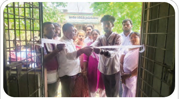
శిబిరాన్ని లిబ్జన్ కట్ చేసి ప్రారంభిస్తున్న సర్పంచ్ పోషన్న

జిల్లా వ్యాప్తంగా మానవ హక్కులపై పార్ట్ ఫిల్మ్ పోటీలలో పాల్గొనడానికి ఆసక్తి గల వారు ఆన్లైన్ ద్వారా దరఖాస్తులు సమర్పించాలని కలెక్టర్ హిత మంగళవారం ఒక ప్రకటనలో పేర్కొన్నారు. జాతీయ మానవ హక్కుల కమిషన్ ఆధ్వర్యంలో 2026 సంవత్సరానికి గాను పార్ట్ ఫిల్మ్ పోటీలకు దేశ పౌరుల నుండి ఆన్ లైన్ ద్వారా ఎంట్రీలను ఆహ్వానిస్తున్నట్లు తెలిపారు. ఈ పోటీలకు వయస్సుతో సంబంధం లేదని, ఆసక్తి కలిగిన ప్రతి ఒక్కరు దరఖాస్తు చేసుకోవచ్చన్నారు. పోటీలలో వేజేతలకు ప్రథమ బహుమతి 2 లక్షలు, ద్వితీయ బహుమతి లక్ష యాభై వేలు, తృతీయ బహుమతి లక్ష రూపాయలు వుందని తెలిపారు. ఆసక్తి కలవారు జూన్ 30 లోపు తమ ఎంట్రీలను గూగుల్ డ్రైవ్ ద్వారా సంబంధిత మేయిల్ కు పంపించాలని కలెక్టర్ తెలిపారు.