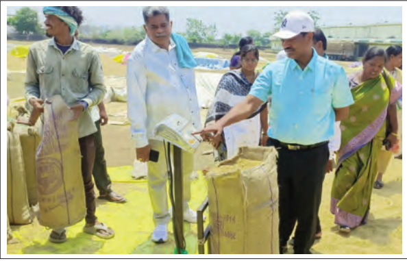
కొనుగోలు కేంద్రాలను సందర్శించి రైతులతో మాట్లాడారు. కొనుగోలు కేంద్రాల వద్దకు రైతులు నిబంధనల ప్రకారం తాలు, తప్ప, తేమ లేకుండా ధాన్యాన్ని తీసుకురావాలని తెలిపారు.