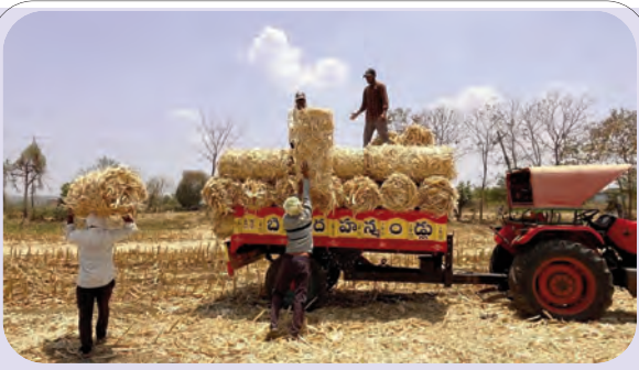
పశుగ్రాసాన్ని సేకరించి నిలువ చేస్తున్న యువకులు